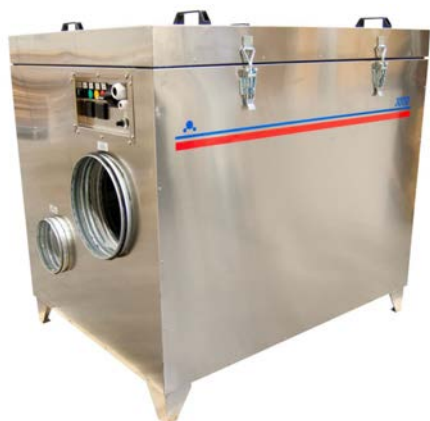
DT-3600, venkovní mrazírenské provedení

Venkovní provedení může být volitelně vybaveno rekuperací tepla vzduch-vzduch, které je umístěno na skříní zařízení. Tepelný výměník výrazně snižuje spotřebu elektrické energie, jelikož přehřívá čerstvý regenerační vzduch a navíc tím i prodlouží životnost filtru regenerace.