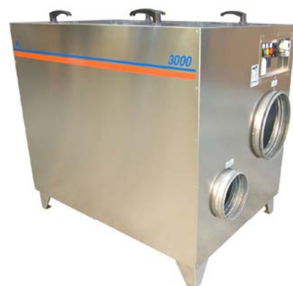
DT-3600, vnitřní mrazírenské provedení